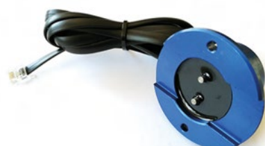
DN-S-W Czujnik rejestrowania obecności wody