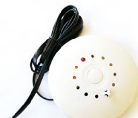
DN-S-S Czujnik rejestrowania obecności dymu